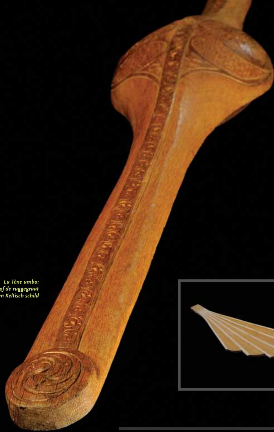
La Tène umbo: het hart of de ruggegraat van een Keltisch schild