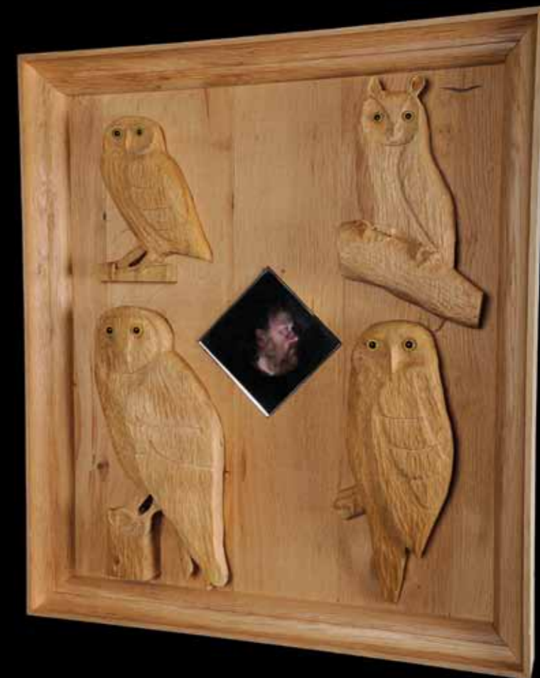
De meest voorkomende uilensoorten van de Vlaamse Ardennen