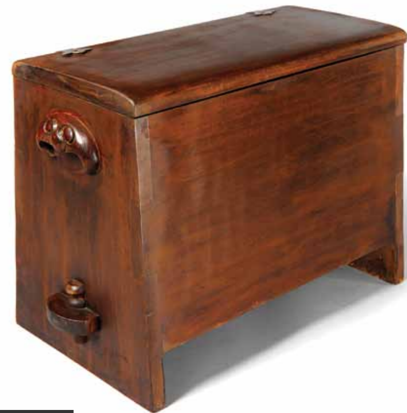
Vikingkist in populier & eik