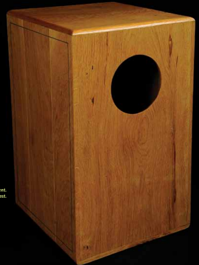
Cajon, snaar/slaginstrument. De snaar zit in de klankkast.

Ondine is 3de-jaarsstudente instrumentenbouw in het conservatorium van Gent. "Mijn specialiteit is viool- en gitaarbouw. Zelf speel ik gitaar, viool en dwarsfluit. Instrumenten worden dikwijls met 'inlegwerk' verfraaid. Ook de Cajon werd hiermee versierd."