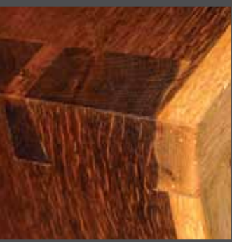
Eiken zitbank met zwaluwstaartverbindingen

"Al heel vroeg reeds, in mijn prille jeugd nog, had ik ontdekt hoe opwindend het was om met hoofd en handen aan de slag te gaan. Ik wou eigenlijk uitvinder worden. En beeldhouwer, of architect misschien. Ik was altijd wel iets aan het knutselen. Later heb ik studies hoger kunstonderwijs gevolgd (toegepaste kunsten).