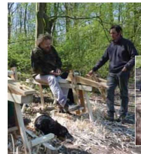
Green Woodwork: verwerking van takhout op primitieve werkbanken

Van oudsher gebruiken mensen allerlei bosproducten in het dagelijks leven. Het is niet omdat ambachten zoals bezembinders, klompenmakers en wagenbouwers definitief tot het cultureel erfgoed behoren, dat Vlaanderen geen ambachtslui meer heeft die uit hout en andere bosproducten zowel nuttige als decoratieve zaken maken. Dit Leaderproject illustreert alvast wat mogelijk is met hout uit eigen regio. Eén van de uitdagingen voor de toekomst is dan ook bepaalde van deze nichemarkten beter te gaan ontwikkelen om op die manier te komen tot een grotere differentiatie van de toepassingen voor het hout uit onze bossen. Dergelijke alternatieve houtverwerking laat bovendien toe om een grote toegevoegde waarde te creëren die ten goede komt aan alle betrokkenen. Werken met een natuurlijk product als hout vraagt echter heel wat 'stielkennis'. Gelukkig hebben we in Vlaanderen goede opleidingscentra die scholing geven hoe een houten plank kan worden omgetoverd in een duurzaam houten voorwerp. Enkele van deze vormingscentra uit de regio zoals het Atheneum uit Oudenaarde en het Provinciaal Centrum Volwassenonderwijs uit Ninove werkten enthousiast mee aan dit Leader-project.