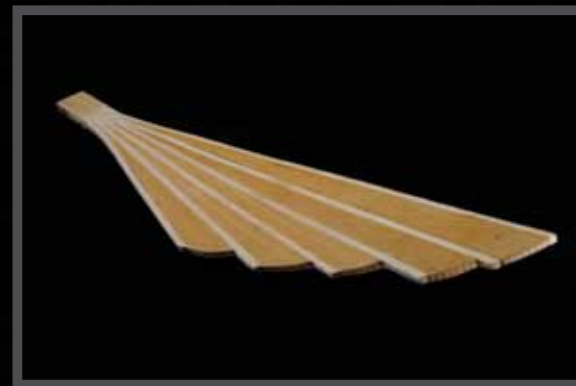
Waaier in populier en eik