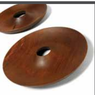
Eiken schalen, gerookt