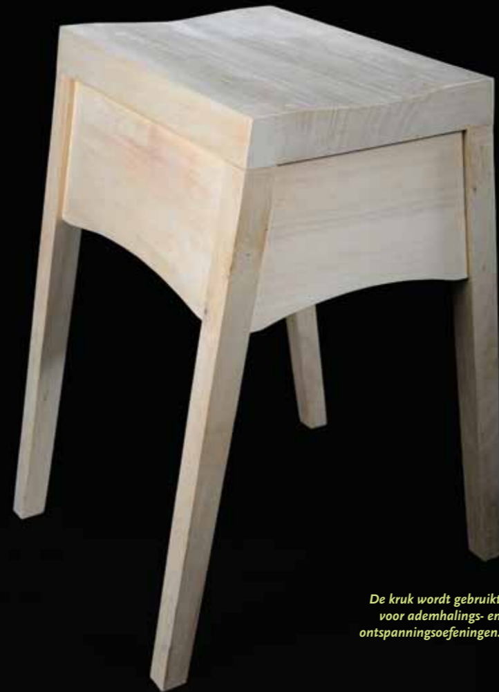
De kruk wordt gebruikt voor ademhalings- en ontspanningsoefeningen.

In het kader van het Leaderproject maakte ik een bio-energetische kruk in populierenhout."