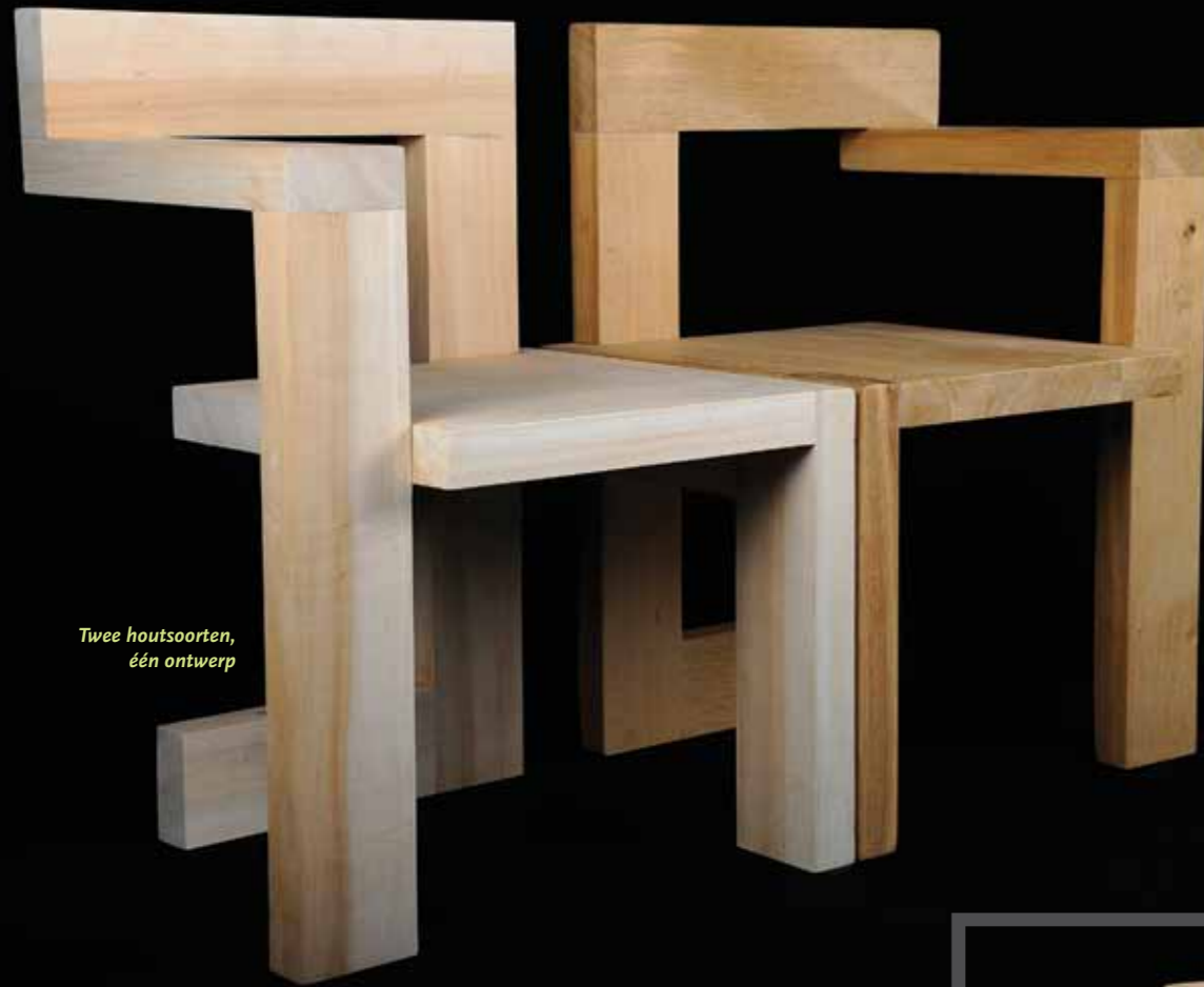
Twee houtsoorten, één ontwerp